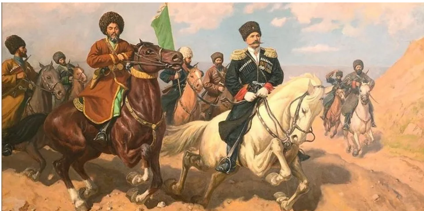
Алиханов во главе туркменской и казачьей конницы

Завязался бой. Афганская конница, понеся большие потери от винтовочного огня, рассеялась и обратилась в бегство. Через несколько часов дрогнула и пехота афганцев. Оставив на поле боя около 500 погибших, она отступила.