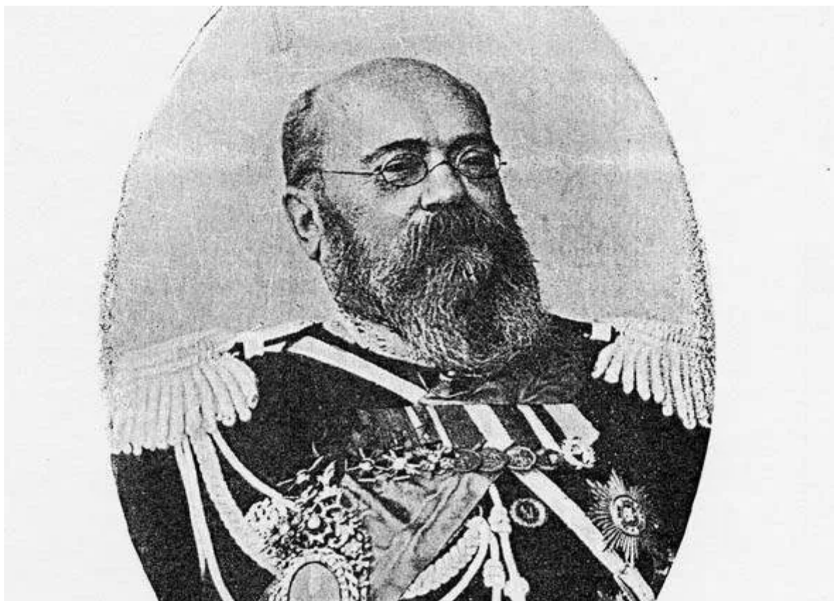
Генерал Александр Комаров

Дело в том, что после подписания мирного договора, туда должны были войти войска Русской императорской армии. Но Форин-офис это совершенно не устраивало, ведь Пенде занимал стратегические высоты на подходе к Герату – воротам к Индии.