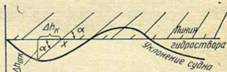
Рис. 2. Схема определения погрешности координирования

Расчет средних значений погрешности \sigma_k производился по книжкам измеренных расходов воды для различных фаз режима. Погрешность координирования при определении расстояний между вертикалями в створе Кипчак составила 5,4%, в Тюямуюне в межень 5,6%, а в паводок возросла до 11,7%. Для площади водного сечения \sigma_{KF} составляет в Кипчаке 1%, в Тюямуюне — в межень 1,1%, в паводок 2,2%.